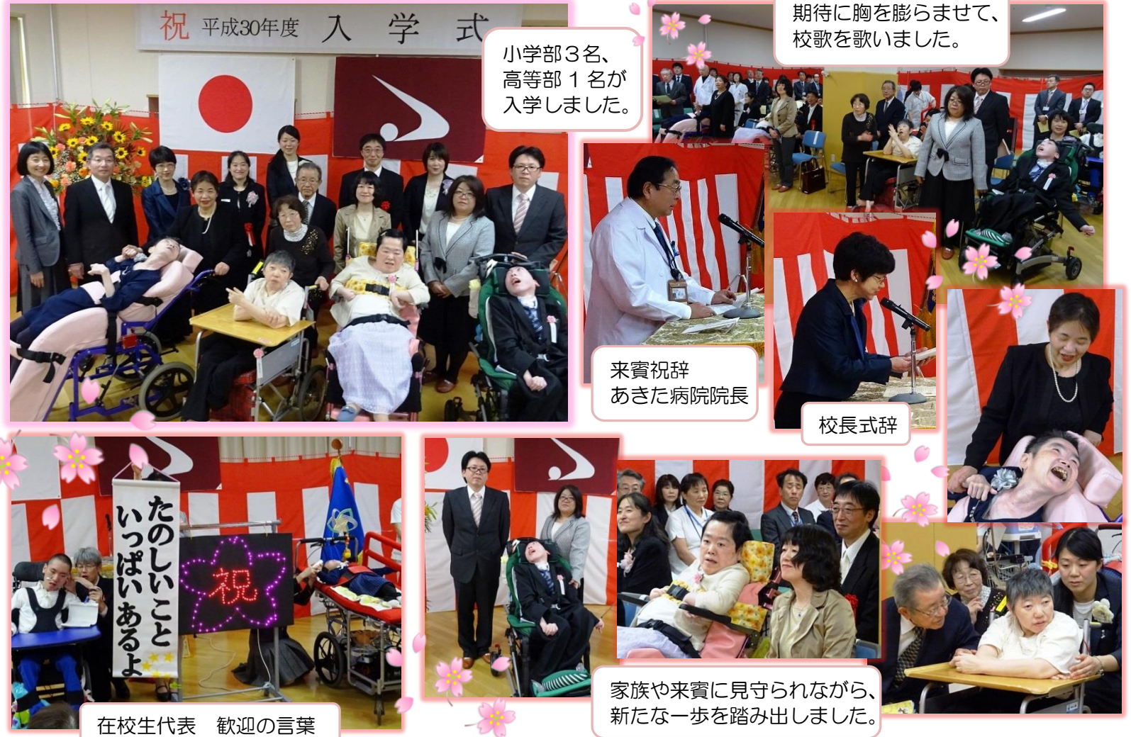
小学部3名、 高等部1名が 入学しました。