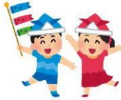
5月は先生と一緒に作った新聞紙の魚をかぶり鯉のぼりを紐で引っ張り揺らして遊びました。入学して1か月。学校生活にも慣れていろいろな学習にチャレンジしているころさんです。