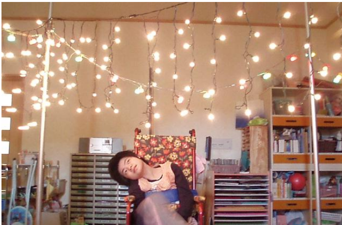
クリスマス電球・ポール