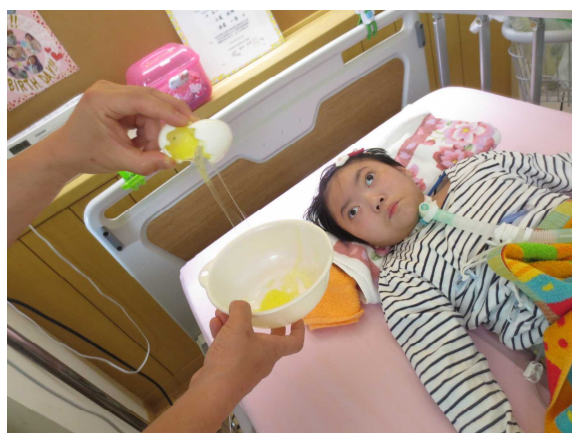
卵のおもちゃとスライムで疑似体験